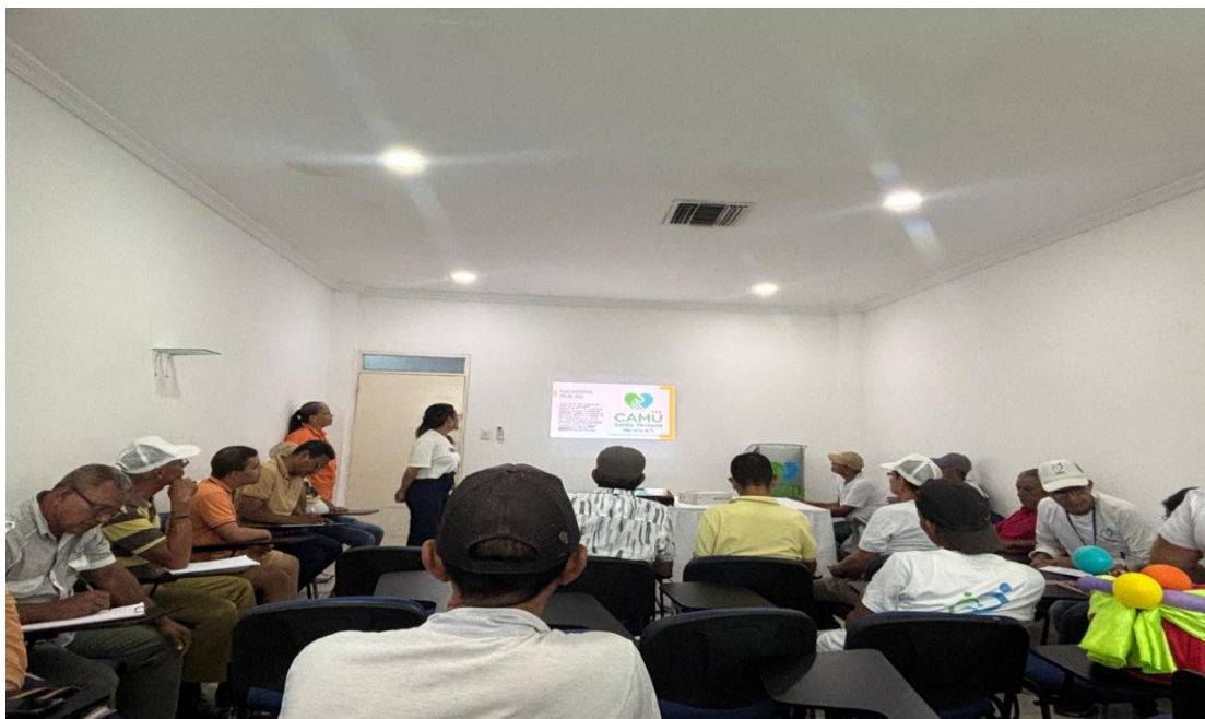
Reunión alianza de usuarios 31 de octubre 2025, Auditorio sede principal E.S.E Camu Santa teresita. 31/10/2025.