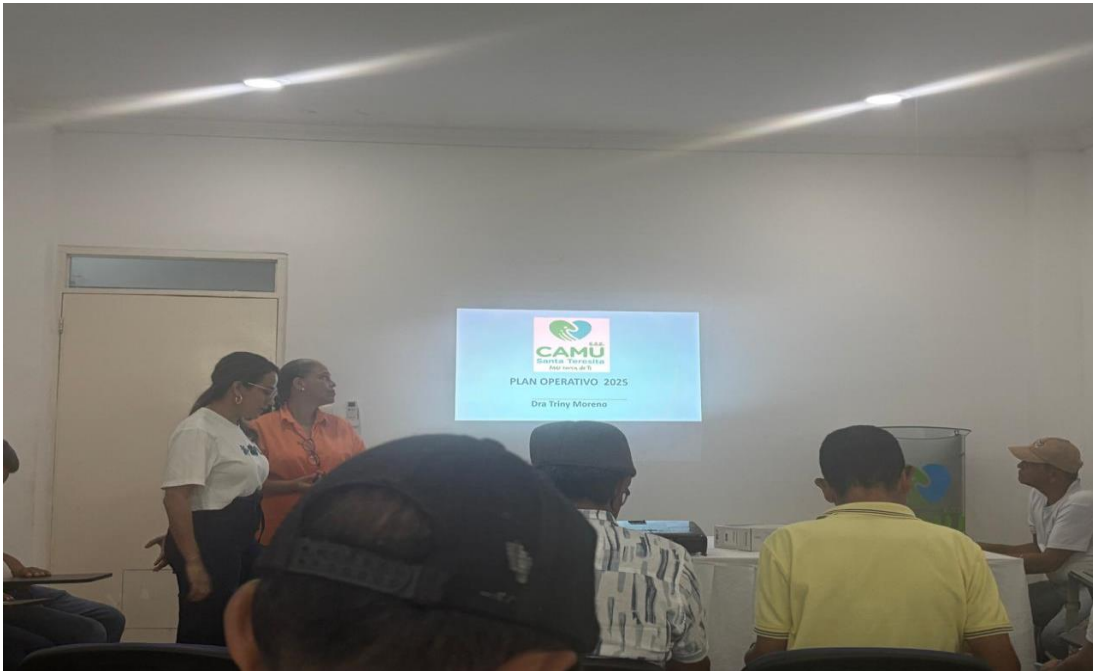
Reunión alianza de usuarios 31 de octubre 2025, Auditorio sede principal E.S.E Camu Santa teresita. 31/10/2025.