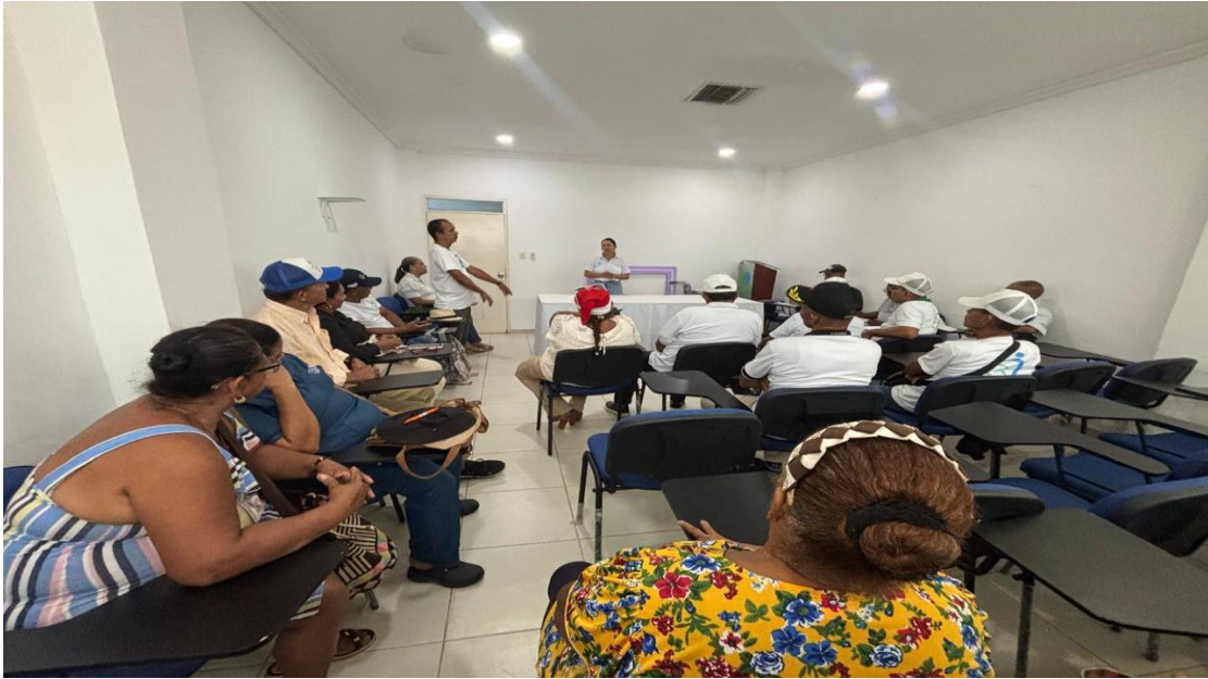
Reunión alianza de usuarios 28 de noviembre 2025, Auditorio sede principal E.S.E Camu Santa teresita. 28/11/2025.