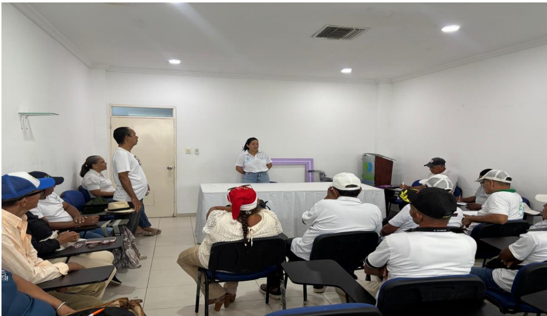
Reunión alianza de usuarios 28 de noviembre 2025, Auditorio sede principal E.S.E Camu Santa teresita. 28/11/2025.