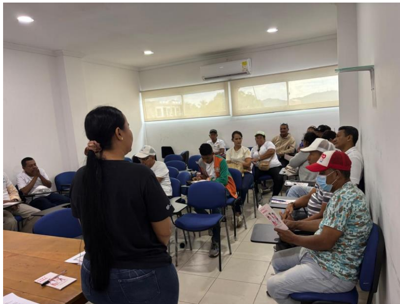
Reunión alianza de usuarios 25 de julio 2025, Auditorio sede principal E.S.E Camu Santa teresita. 27/06/2025.