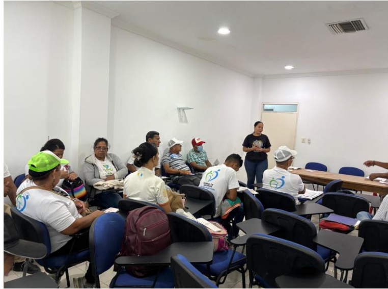
Reunión alianza de usuarios 25 de julio 2025, Auditorio sede principal E.S.E Camu Santa teresita. 27/06/2025.