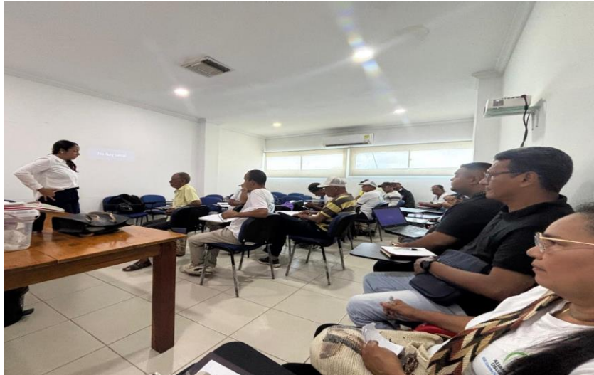
Reunión alianza de usuarios 29 de agosto 2025, Auditorio sede principal E.S.E Camu Santa teresita. 29/08/2025.