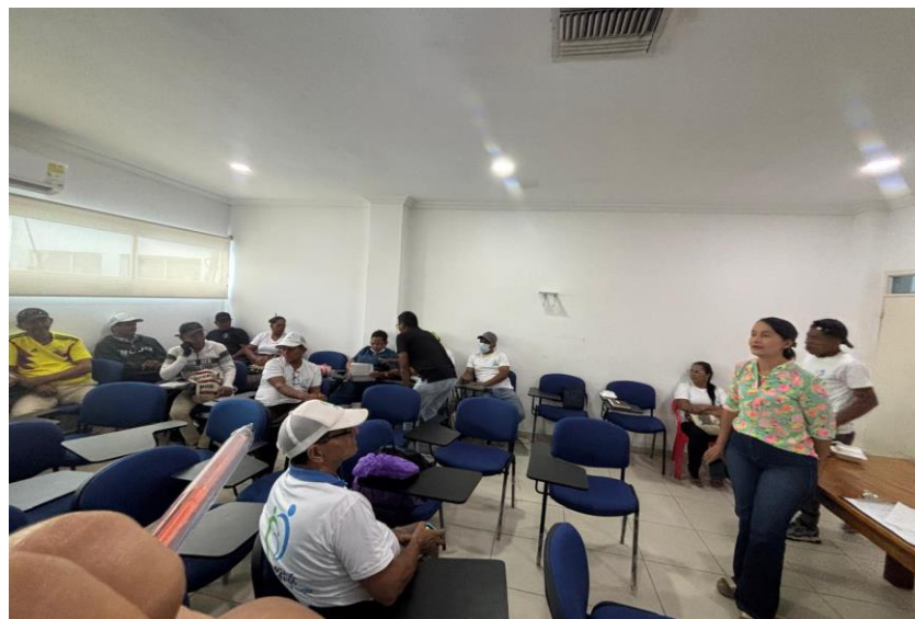
Reunión alianza de usuarios 29 de agosto 2025, Auditorio sede principal E.S.E Camu Santa teresita. 29/08/2025.